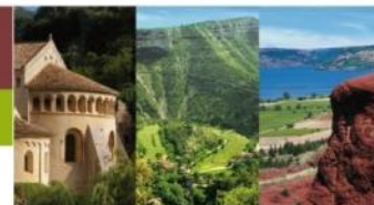
St Guilhem-le-désert Gorges de l'Hérault Lac du Salagou et Cirque de Mourèze Cirque de Navacelles Grands Sites

A l'attention des Délégués (ées) du Comité Syndical du SYDEL du Pays Cœur d'Hérault