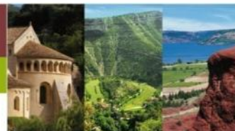
St Guilhem-le-désert Gorges de l'Hérault Lac du Salagou et Cirque de Mourèze Cirque de Navacelles Grands Sites

A l'attention des Délégués (ées) du Comité Syndical du SYDEL du Pays Cœur d'Hérault