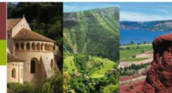
St Guilhem-le-désert Gorges de l'Hérault Lac du Salagou et Cirque de Mourèze Cirque de Navacelles Grands Sites