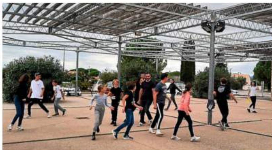
Une quarantaine de jeunes participera au spectacle "Bimatch" avec le collectif BIM ce samedi. NATHALIE POCH

« Ce sera un spectacle participatif, aux allures de compétition sportive officielle, avec des règles, des arbitres, des juges, des commentateurs et des spectateurs », dévoile Liza Blan-