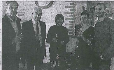
Pour sa deuxième édition, les Floréales du vin ont attiré plus de participants.

Pour cela, chaque restaurateur proposera, le temps des Floréales, neuf cuvées « coup de cœur », d'un mois trois vigneron « du territoire », et réalisera une animation autour du vin. De la mise en musique d'une dégustation à un dîner dans le noir, chaque estamineur