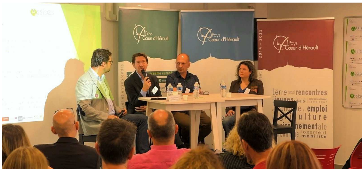
Table ronde 2 - TRANSITION ! - « TPE, Comment passer au numérique ? »

L'entreprise face aux enjeux des changements numériques : faut-il passer au tout numérique ? Quels avantages en attendre ? Comment s'en faire un allié et par quoi