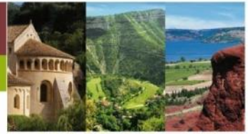
St Guilhem-le-désert Gorges de l'Hérault Lac du Salagou et Cirque de Mourèze Cirque de Navacelles Grands Sites

A l'attention des Délégués (ées) du Comité Syndical du SCoT du SYDEL du Pays Cœur d'Hérault