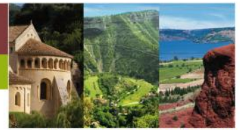
St Guilhem-le-désert Gorges de l'Hérault Lac du Salagou et Cirque de Mourèze Cirque de Navacelles Grands Sites

A l'attention des Délégués(ées) du Comité Syndical du SYDEL du Pays Cœur d'Hérault