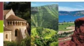
St Guilhem-le-désert Gorges de l'Hérault Lac du Salagou et Cirque de Mourèze Cirque de Navacelles Grands Sites